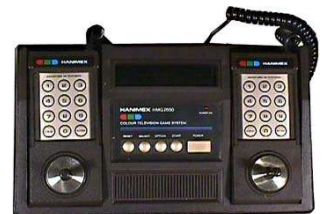
Hanimex HMG-2650 Europa/Australia