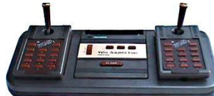
Prestige MPT-03 Francja