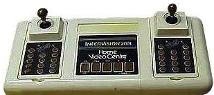
Intervention 2001 Północna Europa