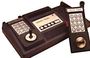
Leisure Vision Kanada