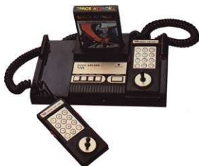
Home Arcade Francja