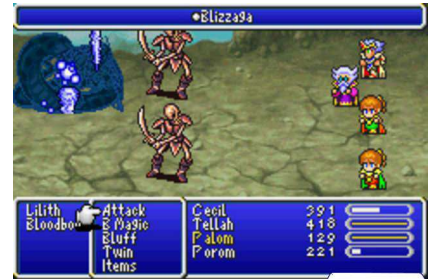
Final Fantasy IV