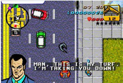
Grand Theft Auto