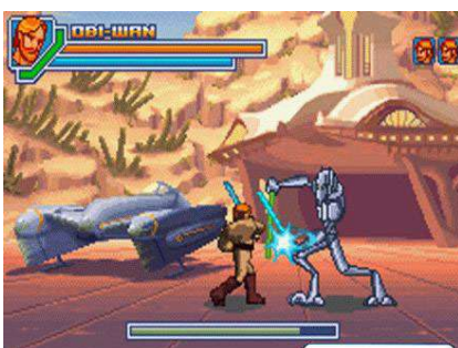
Star Wars - Zemsta Sithów