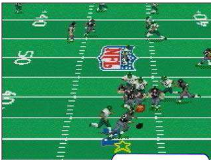
Madden NFL 2004