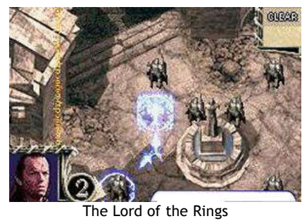
The Lord of the Rings