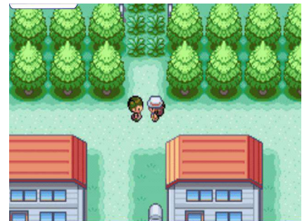
Pokemon Fire Red