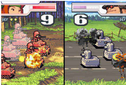
Advance Wars 2